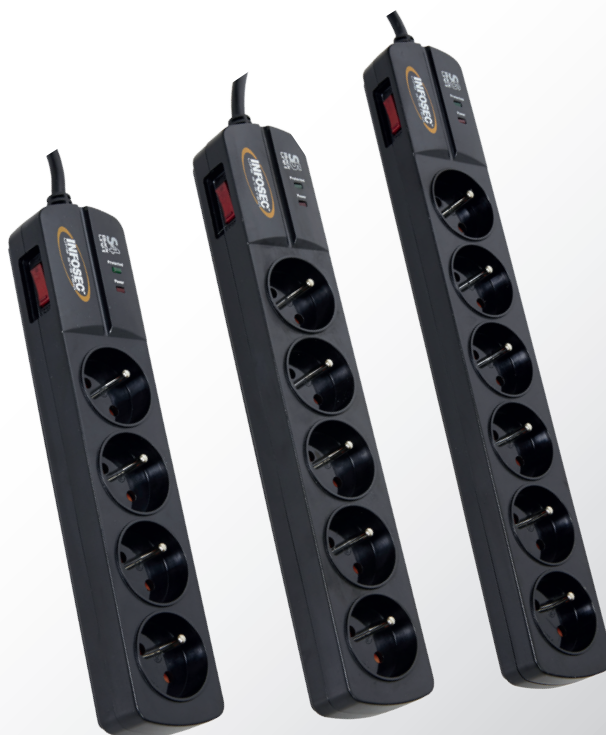
S4 Black Line II

Dans le cadre de sa démarche environnementale, certifiée ISO 14001 , Infosec s'engage à rechercher de nouveaux procédés plus écologiques. C'est ainsi que les emballages de la nouvelle collection de parasurtenseurs ont été réalisés en PVC Green , plus léger, et incluant des composants moins polluants pour l'environnement que le PVC standard. Les cartons et papiers imprimés sont composés à plus de 50% de papier recyclé et peuvent faire l'objet d'un tri sélectif.