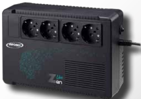
Zen Live 500 / 650 VA