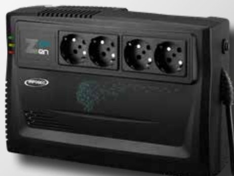
Zen Live 800 / 1000 VA